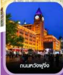
ถนนทวิงฟู่จิ่ง