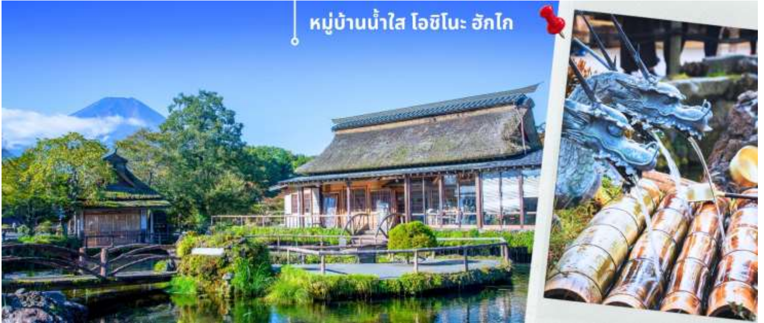
หมู่บ้านน้ำใส ไอชิโนะ อักโก

นำท่านแวะชม พิพิธภัณฑ์แผ่นดินไหว เป็นพิพิธภัณฑ์ที่แสดงถึงผลกระทบจากภัยพิบัติแผ่นดินไหวและการระเบิดของภูเขาไฟ ภายในพิพิธภัณฑ์มีห้องจัดแสดงข้อมูลการประทุของภูเขาไฟจากทุกมุมโลก โชนความรู้ต่างๆและโซนช้อปปิ้งสินค้าญี่ปุ่น อาทิเช่น ผลิตภัณฑ์เครื่องสำอางและของฝากอีกมากมาย