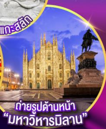
ถ่ายรูปด้านหน้า "มหาวิหารมิลาน"