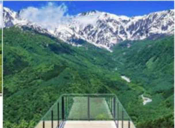
HAKUBA MOUNTAIN HARBOR THE CITY BAKERY