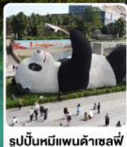
รูปปั้นหมีแพนด้าซาหลี่