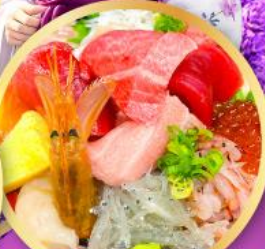
ตลาดปลาฮิมิสู คาชิโมะจิ

ถ่ายรูปเชคอินวิวฟูจิ กับซุ้มประตูโทเซคิจิ แชนมอน อิสระท่องเที่ยว ซอปปิงหนึ่งวันเต็มในโตเกียว