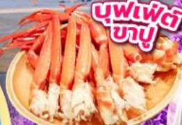
บุฟเฟ่ต์ ซาซู