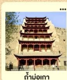
ถ้ำม่อเถา