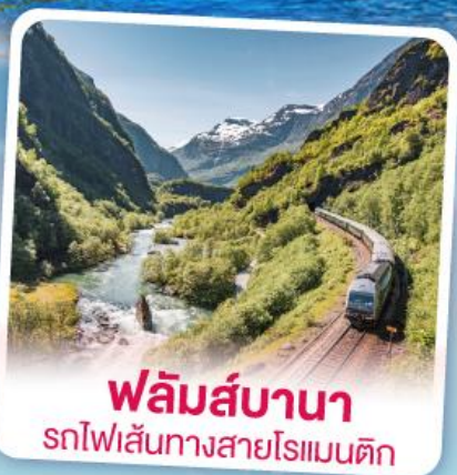
พลัมส์บานา รถไฟเส้นทางสายโรเมนติก