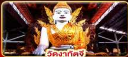
วัดงาทัดจี

สิทธิการะ 3 มหาบุชาสถาน พักบนอินทร์แวน 1 คืน